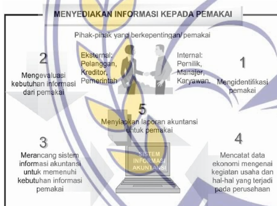
Ilustrasi 2: Informasi Akuntansi dan Pihak yang Berkepentingan

Proses dimana akuntansi menghasilkan informasi bagi pengguna dijelaskan pada ilustrasi 2.