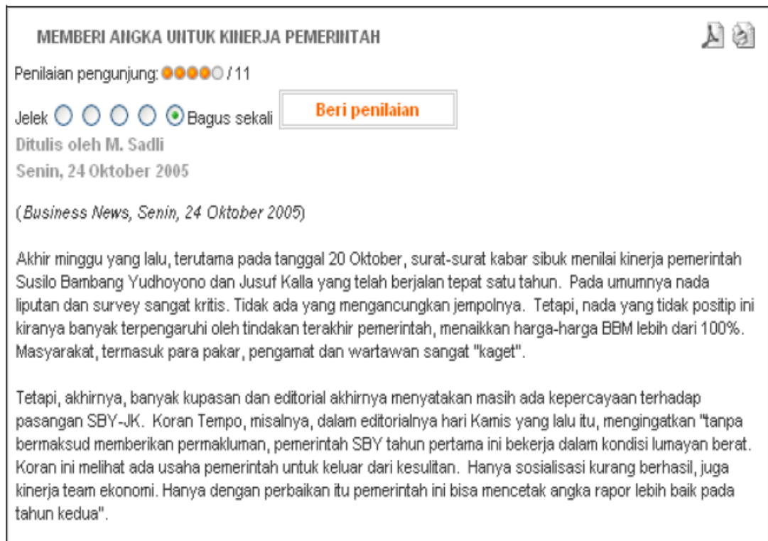
Gambar - 1-1

Para manajer di berbagai organisasi juga diharapkan dapat dengan lebih mudah untuk menganalisis kinerjanya secara konstan dan konsisten dengan pemanfaatan teknologi informasi yang tersedia.