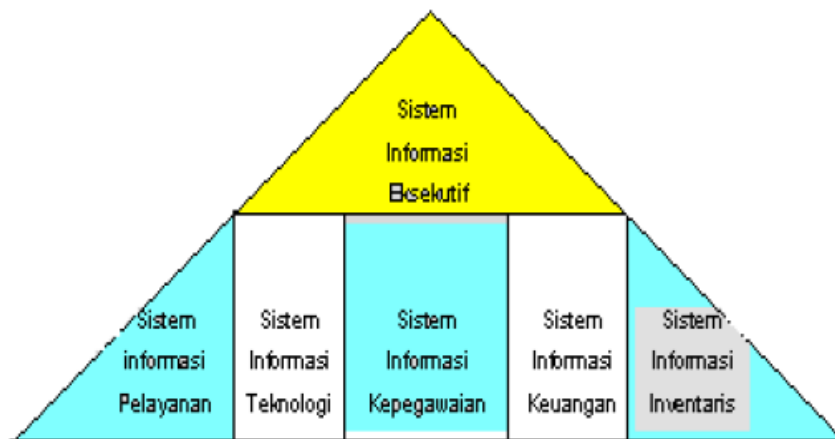
Gambar 2 - 4

Gambar 2 - 4 memperlihatkan pembagian SIM menjadi subsistem-subsistem organisasi walaupun tampak adanya garis-garis pemisah