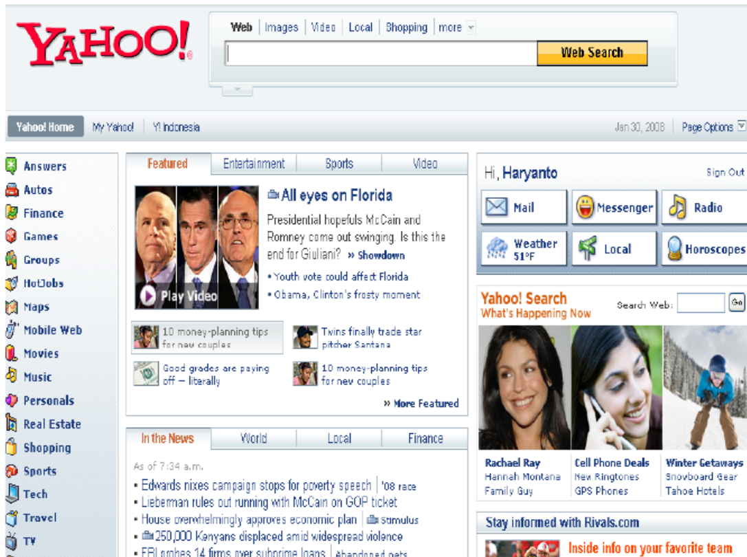
Gambar 2 - 3

Pertumbuhan yang pesat di teknologi komputer dan jaringan, termasuk teknologi internet telah mengubah struktur organisasi yang memungkinkan secara instan informasi didistribusi di dalam dan di luar organisasi. Kemampuan ini dapat digunakan untuk mendesain ulang dan mempertajam organisasi, mentransfer struktur organisasi, ruang lingkup organisasi, melaporkan dan mengendalikan mekanisme, praktik-praktik kerja, arus kerja, serta produk dan jasa. Pada akhirnya, proses bisnis yang